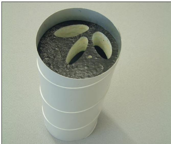
Primer vgradnje dušilnika INNO v spiro cev

vgrajena v okrogli prezračevalni kanal, ob tem pa lahko z njim reguliramo tudi pretok zraka in s tem zmanjšamo število dušilnih loput. V prezračevalnih sistemih se tako dušenje zvoka in pri tem nižanje tlaka