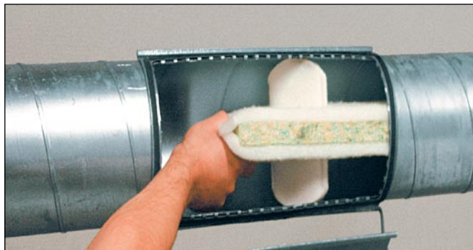
Primer vgradnje dušilnika SAVA za revizijskimi vratci

izredno izboljša. Zaradi manjšega števila konvencionalnih dušilnikov zvoka in regulatorjev pretoka v instalacijah, zagotavlja SAVA dušilnik visoko kakovostno in cenovno ugodno rešitev. INNO je prav tako dušilec za okrogle prezračevalne kanale. V celoti je narejen iz penaste mase z izrednimi sposobnostmi dušenja zvoka.