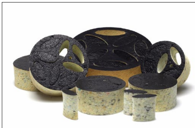
Dušilniki INNO različnih dimenzij

izredno izboljša. Zaradi manjšega števila konvencionalnih dušilnikov zvoka in regulatorjev pretoka v instalacijah, zagotavlja SAVA dušilnik visoko kakovostno in cenovno ugodno rešitev. INNO je prav tako dušilec za okrogle prezračevalne kanale. V celoti je narejen iz penaste mase z izrednimi sposobnostmi dušenja zvoka.