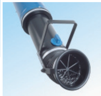
Absaugdüse mit 360° Drehgelenk

Die Fumex Produktpalette bietet ebenfalls Ventilatoren, Zubehör und Steuerautomatik für die jeweiligen Punktabsauger.